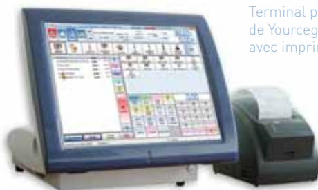
Terminal point de vente équipé de Yourcegid Restaurant WIN avec imprimante ticket

*Yourcegid Hôtel WIN est le progiciel de gestion hôtelière pour l'hôtellerie indépendante.