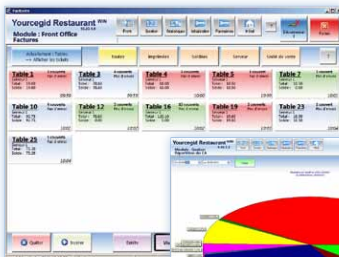
Visualisation des tables ouvertes