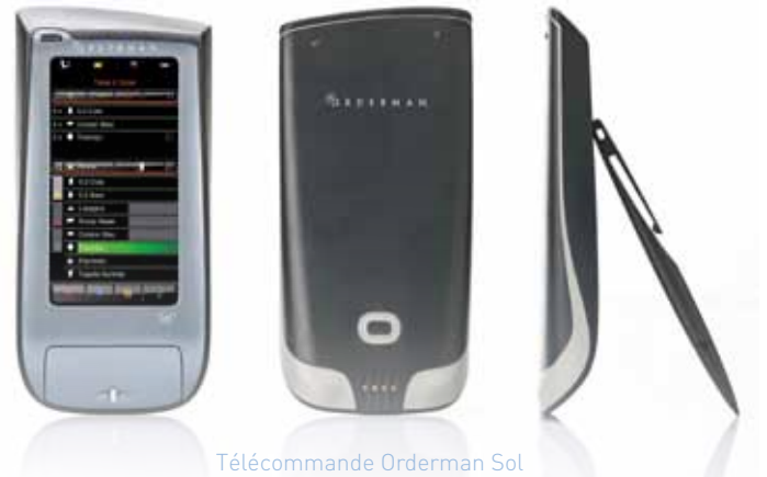
Télécommande Orderman Sol