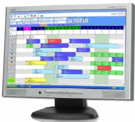
Planning des réservations